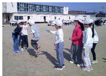
クラスの仲間と一つになって頑張った大縄大会