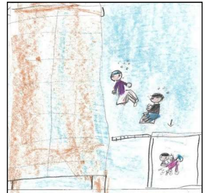
プールで深いところにもぐる