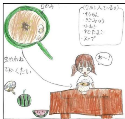
中華風そうめんづくり