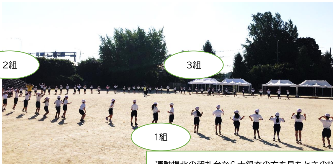
運動場北の朝礼台から大銀杏の方を見たときの様子