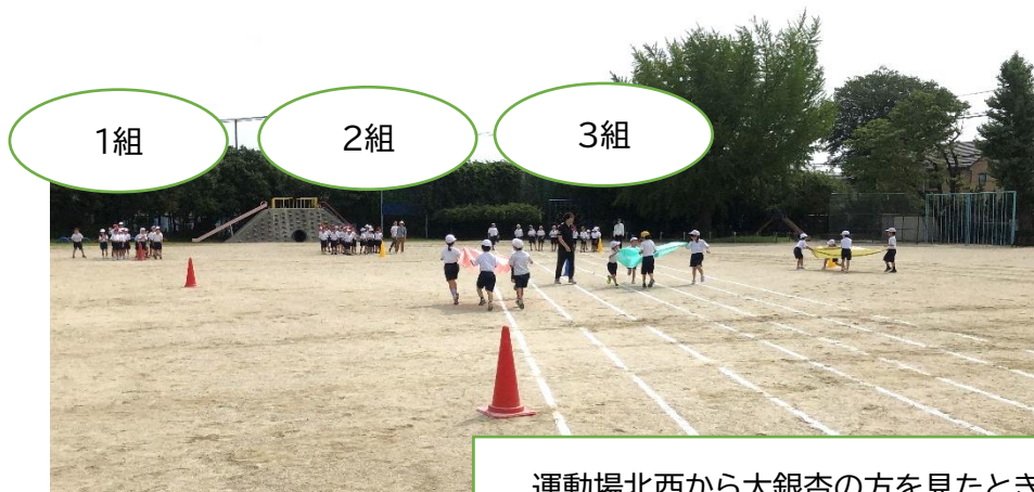
運動場北西から大銀杏の方を見たときの様子