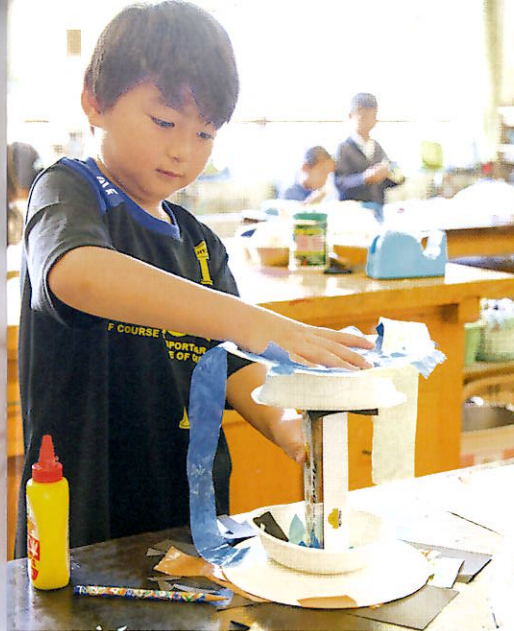
チョウチョの コロコロゆらりん 【はば25cm/ かみコップ、いろがようし、 こうさくようし】