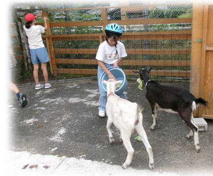
やぎとのふれあい