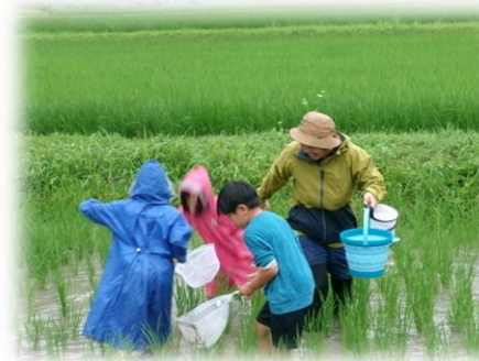
命のプログラム（田んぼの生き物観察）