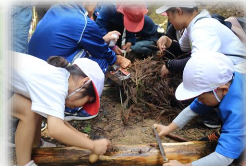
富士山の里山での活動