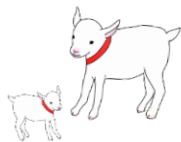
三和小保護者 Tさん

大きな学校で、切磋琢磨し鍛えられたほうがいいという考え方もありますが、子どもに穏やかにゆったり明るく小学校生活を送らせてあげたいと思われるなら、三和小学校がお勧め！自分が大切にされていることを、お子さん自身がきっと感じられると思います。三和小は、蛍のように一人一人が輝ける学校だと思います！