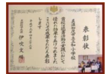
読書活動文部科学大臣賞 H19.4