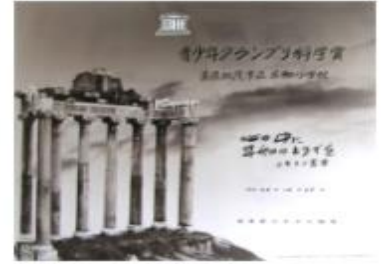
ユネスコグランプリ表彰 S63.19

第15回ホタルコンサート参加 第16回ホタルコンサート参加 第17回ホタルコンサート参加 第18回ホタルコンサート参加