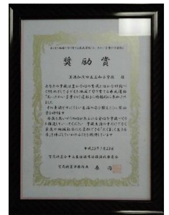
あったかい言葉かけ運動奨励賞 H25.1