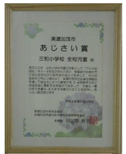
美濃加茂市あじさい賞 H28.2