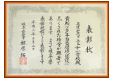
自然環境保護表彰 H3.5