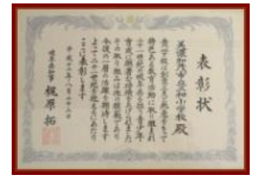
特色ある教育活動表彰 H12.8