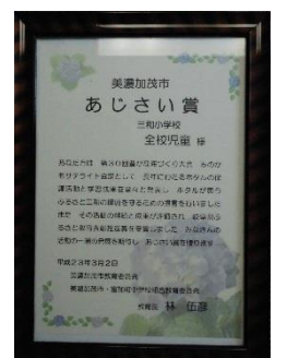
美濃加茂市あじさい賞 H23.3