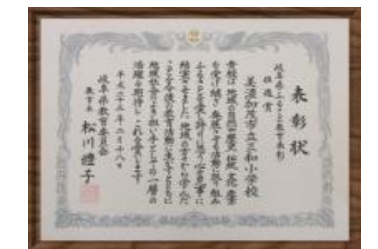
岐阜県ふるさと教育賞推進賞 H23.3