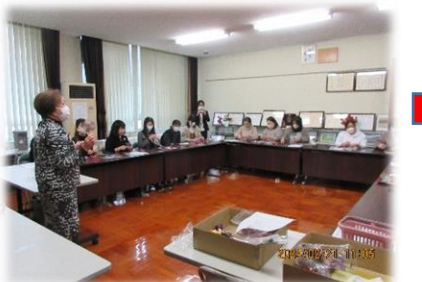
さあ、始めましょう。

司会：副学級長さん 挨拶：学級長さん 学び合って知識を深めましょう。 交流しながら楽しく進めましょう。