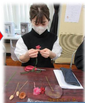
黙々と手を動かしておられます。