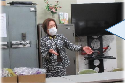
経験に基づいた素敵なお話し

この日は、「コサージュ作り」「給食試食会」「食に関わる講話」「閉級式」と内容が盛りだくさんでした。最初の活動「コサージュ作り」を中心に、学級の様子を紹介します。