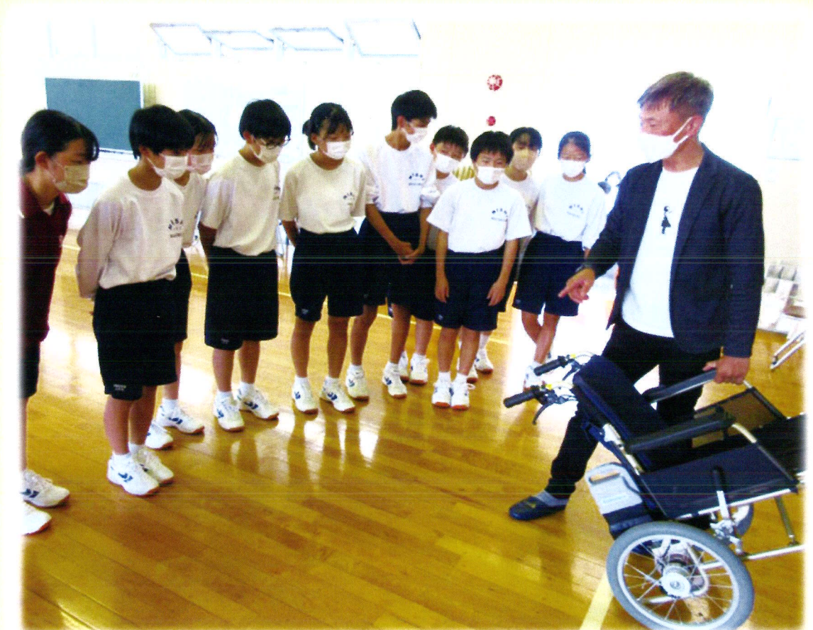
(西中学校 福祉体験学習 講師：地域の企業 エムエスサービス)

(中央教育審議会答申「新しい時代の教育や地方創生の実現に向けた学校と地域の連携・協働の在り方と今後の推進方策について」)