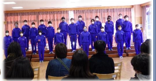
久しぶりに聴く中学生の歌声に感動!