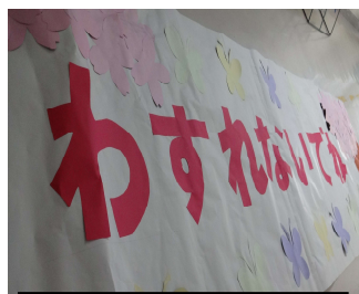
廊下を飾る掲示物