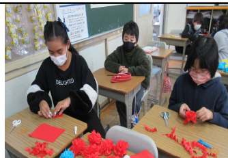
5年生は、たくさんの担当がありましたが、気持ちを込めてやりとげました