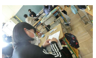
6年生の手縫いのぞうきん 大切に使います