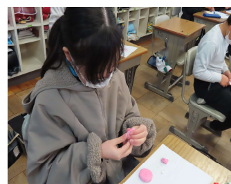
どんなプレゼントがよいか話し合い、手作りマグネットを作りました