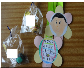
メッセージと似顔絵

さらに、5年生は6年生が卒業した後の最高学年として、会の企画・運営も行います。2月は送る会の成功に向けて全校が一丸となり準備に取り組んだ1カ月でした。