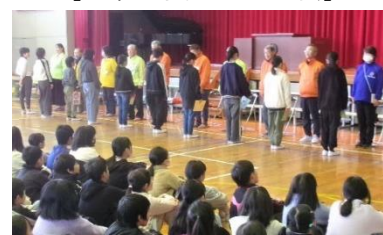
[交通安全感謝の会]