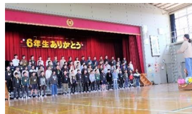
[6年生ありがとうの会]

今年度も終わりが近づいてきました。これまで大きな事故や事件はありませんでした。これも保護者や地域の皆様のご理解ご協力あつてのことです。蜂屋っ子の成長を見届けて今年度も無事締めくくれることに感謝申し上げます。令和6年度もありがとうございました。